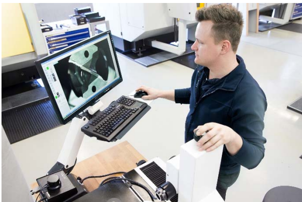
Bild 4: Das Einstellgerät stellt hohe Fertigungsqualitäten und exakte Toleranzen sicher.

Bild 3: Die Messmittelfähigkeitsprüfung weist mit verschiedenen gängigen Verfahren nach, dass das Einstellgerät Werkzeuge in der gewünschten Toleranz vermisst.