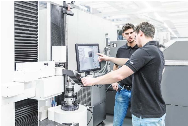
Bild 3: Die Messmittelfähigkeitsprüfung weist mit verschiedenen gängigen Verfahren nach, dass das Einstellgerät Werkzeuge in der gewünschten Toleranz vermisst.